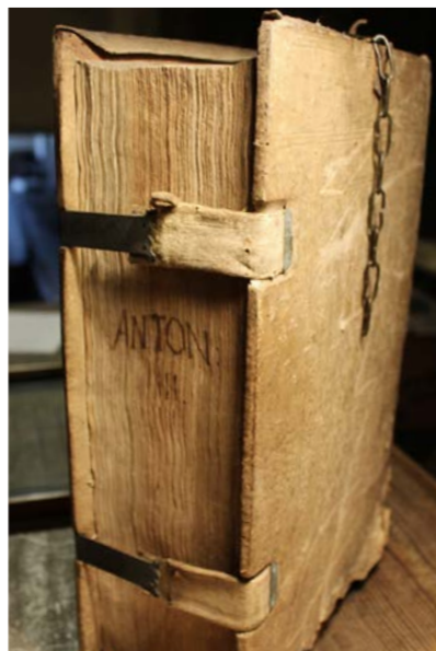
Ein Buch aus dem 15. Jahrhundert mit Schließen und der Öse mit Kette