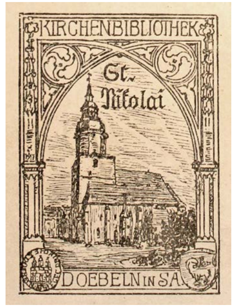
Exlibris der Kirchenbibliothek St. Nicolai Döbeln, womit das Eigentum des Buches signalisiert wird