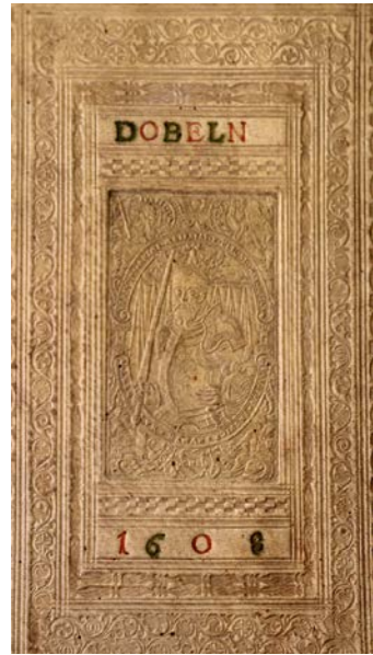
Buch der Reformationszeit mit Ledereinband und Döbelner Prägung