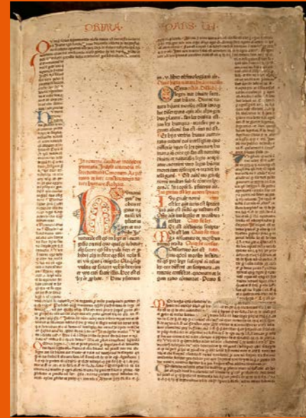
Das älteste Buch ist das Decretum, welches 1472 in Straßburg gedruckt wurde. In der Mitte ist der eigentliche Text, rechts und links sind verschiedene Kommentare gedruckt.